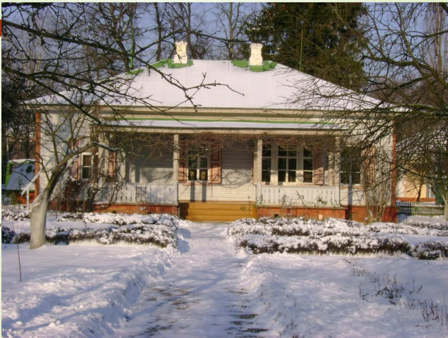
Музей-заповідник Михайла Коцюбинського м. Чернігів