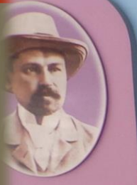
Микола Михайлович Коцюбинський 1864-1913