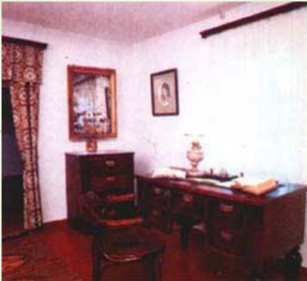
Кабинет М.М Коцюбинського