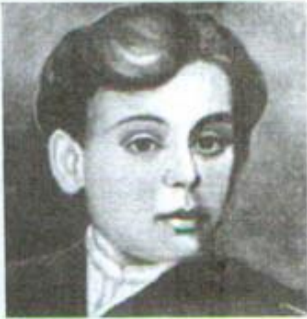
М. Коцюбинський. Фото поч. 70-х років

► Дитячі і юнацькі роки письменника минули в селах і містечках Поділля. Вони й дали ті перші незабутні враження, які наш великий земляк проніс через усе життя. Початкову освіту одержав удома, тому 1875 р. вступив до 9-го, останнього класу Барського народного училища. Навчання продовжив 1876-1880 р. у Шаргородській духовній школі, після закінчення якої готувався до вступу в університет у Кам'янець-Подільській публічній бібліотеці. Але мрія юнака про вищу освіту виявилася нездійсненою.