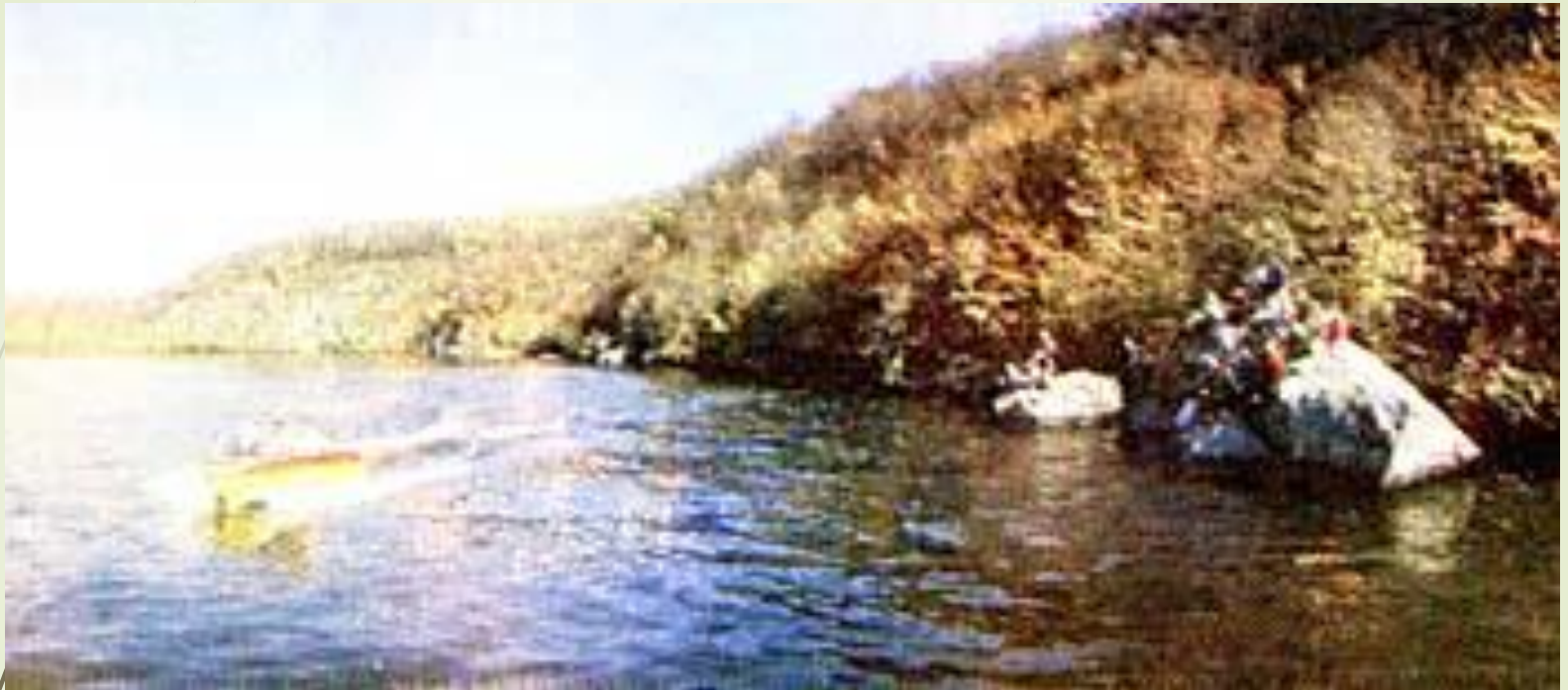
Камінь Коцюбинського на річці Південний Буг у Вінниці