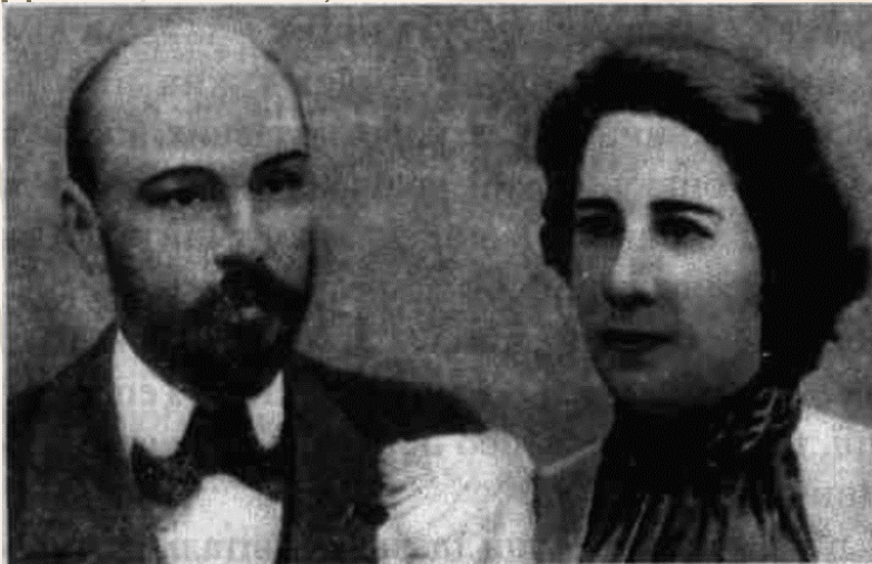
М. Коцюбинський з дружиною Вірою Устимівною

Згодом (1898 року) Михайло Михайлович переїхав у Чернігів, прикипівши душею до цього придеснянського куточка. Спочатку займав посаду діловода при земській управі, тимчасово завідував столом народної освіти та редагував «Земский сборник Черниговской губернии». У вересні 1900 влаштувався до міського статистичного бюро, де працював до 1911. В Чернігові зустрів Віру Устимівну Дейшу, закохався, і вона стала його дружиною — вірним другом та помічником.