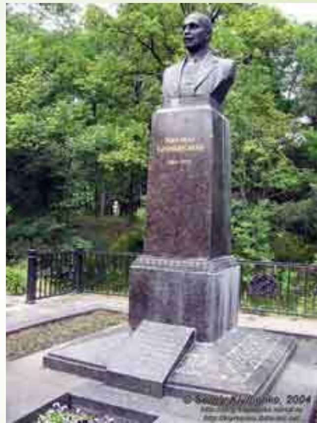
Пам'ятники Коцюбинському в м. Вінниця