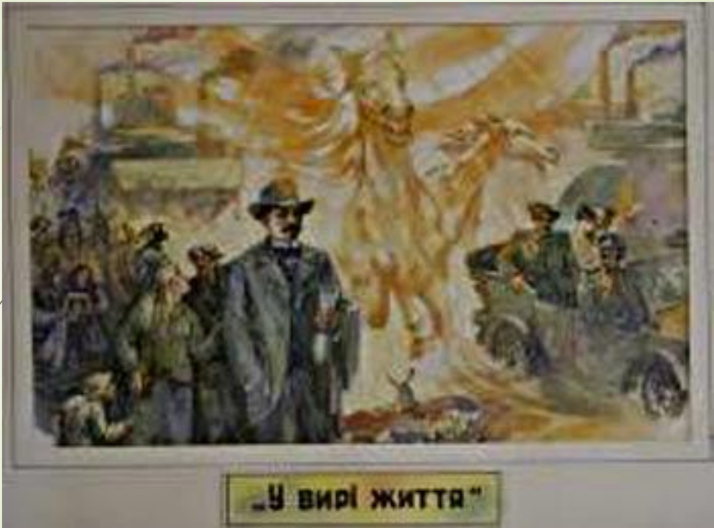
Ілюстрації до творів письменника