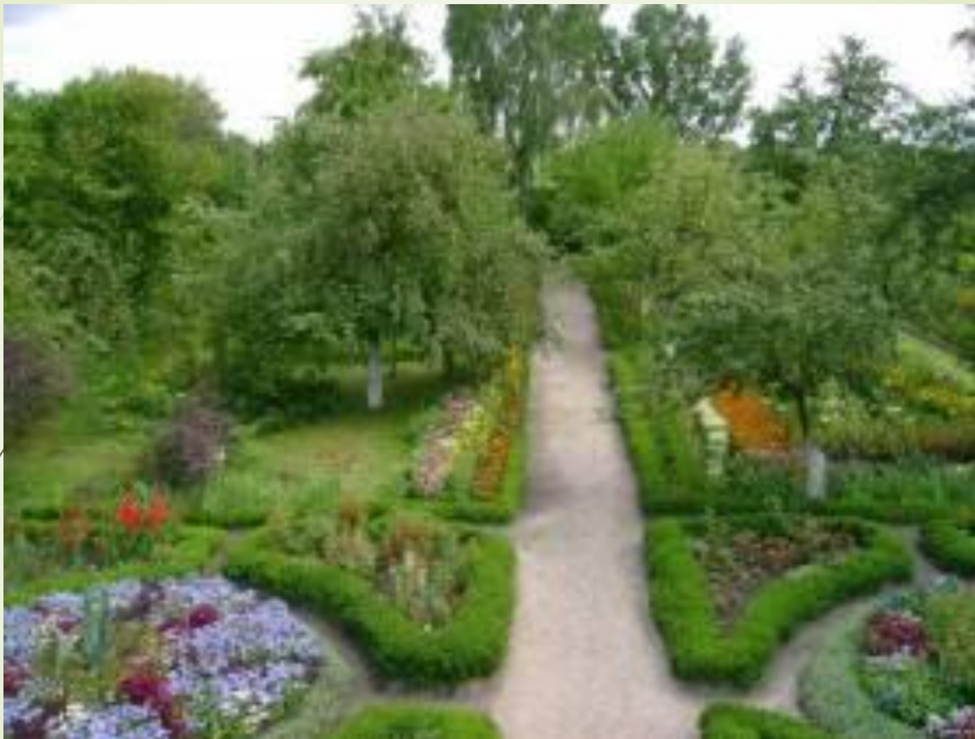
Вид меморіального саду Коцюбинських