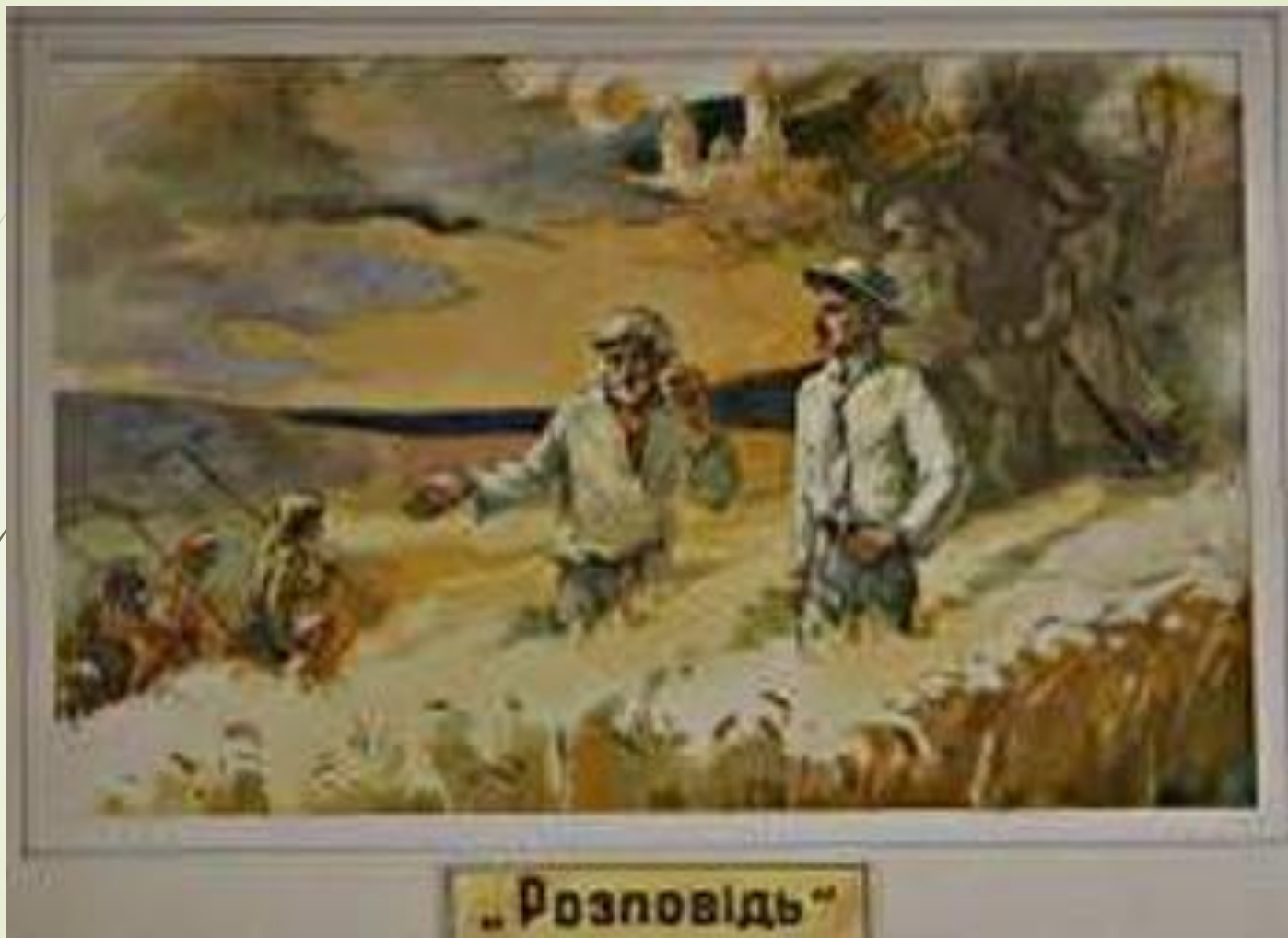
Ілюстрації до творів письменника